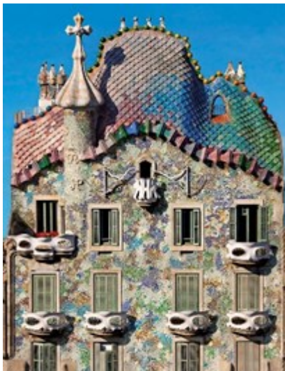
Casa Batlló-Antoni Gaudí-Barcellona

Attraverso le sue forme ispirate alla natura e l'integrazione tra diverse discipline artistiche, l'Art Nouveau lascia un'eredità duratura perché non è solo un movimento artistico, ma una vera e propria filosofia di vita.