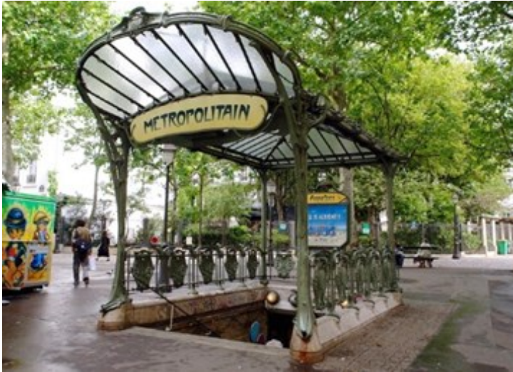
Ingressi della metropolitana di Parigi-Hector Guimard